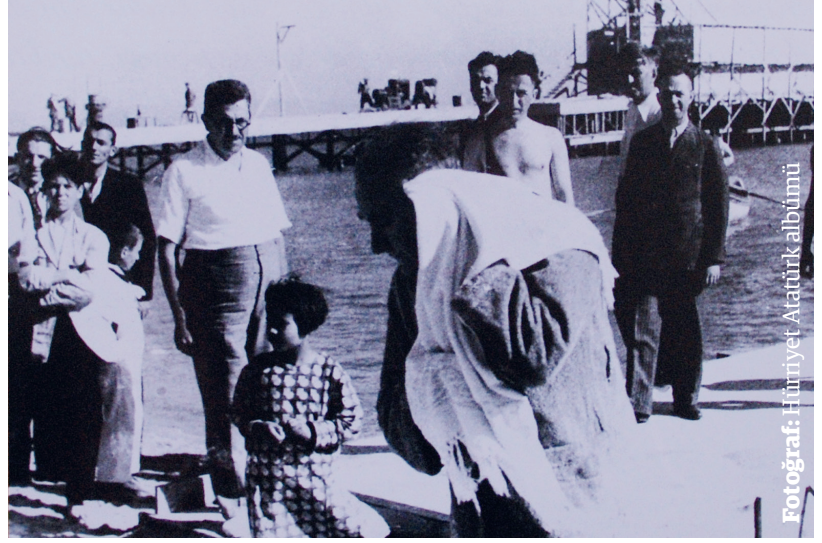
Atatürk Flarya Plajı'nda halkla birlikte denize girerken.

İsmet İnönü ile hayatının son dönemlerinde dargın olduğunu hepimiz biliyoruz. Hastalığının başladığı dönemde Ankara'daki bir törene Atatürk gidemediği için İnönü katılıyor ve halk onu ayakta alkışlıyor. Birileri bunu Atatürk'e kabahatmiş gibi anlat-