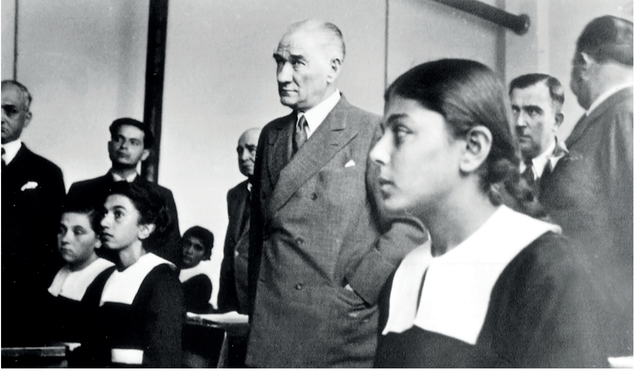
Atatürk okul ziyaretinde

kafasında yer alan gelecekteki toplumdur.