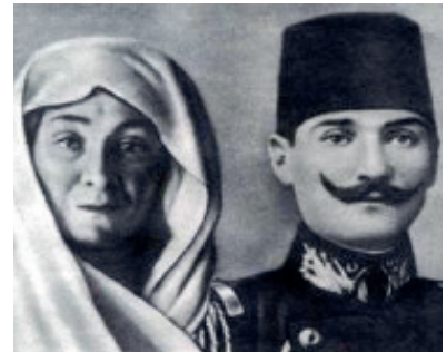
Zübeyde Hanım ve Ali Rıza Bey