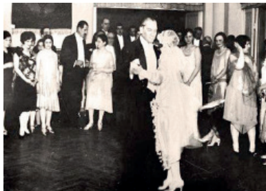
Atatürk vals yaparken

Kesinlikle çok severdi. Yani onun özellikle sözünü ettiğimiz sofralarda, seyahatlerde ne kadar esprili bir insan olduğunu görüyoruz. Örneğin, İstanbul'da limana bağlı bir gemide yemek veriliyor ve iş dünyasının önemli insanları davet ediliyor. Önde gelen iş adamlarından biri kadehini kaldırıyor ve Atatürk'e şerefimize diyerek fondip yapıyor. Bu sofraya adetlerine göre aslında bir düellodur ve Atatürk de bu hareket üzerine bir dikişte rakıyı yuvarlıyor. Birkaç dakika sonra o iş adamı kaldırıyor rakıyı, yine şerefimize beyefendi diyerek fondip yapıyor ve Ata-