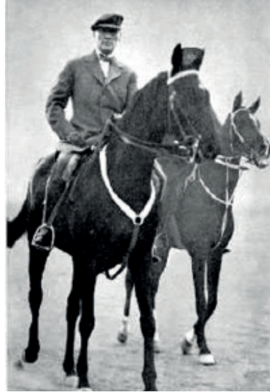
Atatürk ve atı Sakarya