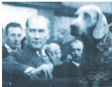
Atatürk ve köpeği Foks

ölümsüz atıdır. Köpeği Foks da yine özel bir yere sahip onun hayatında. Atlar ve köpeklerle birlikte, her türlü hayvana sıcakkanlı bir doğaseverdi. Foks büyük bir trajedi olmuştur onun için. Fakat Atatürk ve hayvan sevgisi denilince benim aklıma ilk gelen hayvan hep at olmuştur.